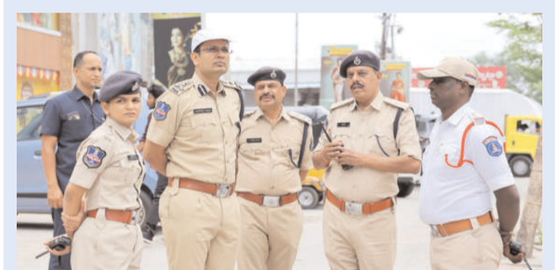
కూకట్ పల్లిలో రోజురోజుకు పెరిగిపోతున్న ట్రాఫిక్ జేపీయూ, కూకట్ పల్లి వై జంక్షన్లో ట్రాఫిక్ పరిస్థితులపై ఉన్నతాధికారుల సమీక్ష ప్రజలకు సౌకర్యవంతమైన ప్రయాణాన్ని అందించడమే లక్ష్యంగా ట్రాఫిక్ నిర్వహణలో సలకాత్మక మార్పులు