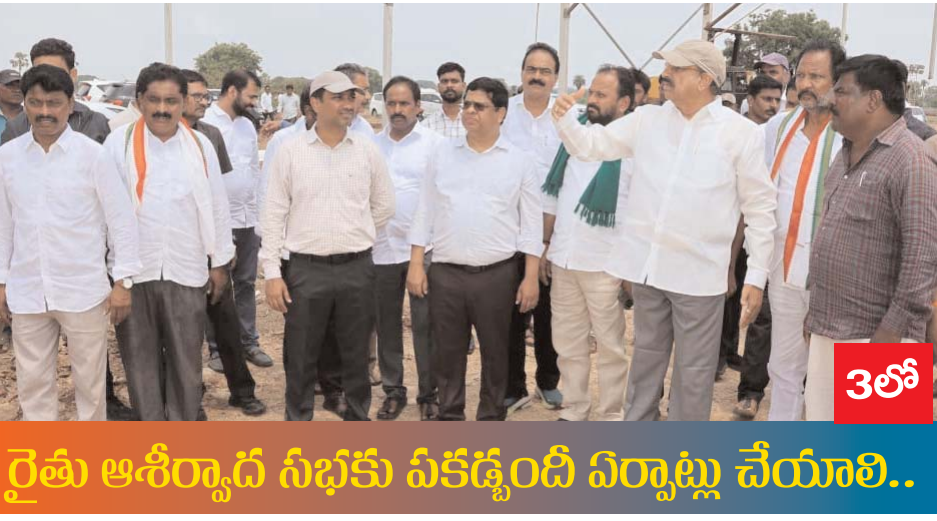
రైతు ఆశీర్వాద సీబీకు ఏకడ్డంది ఏర్పాటు చేయాలి..