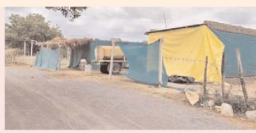
కాలేశ్వరంలో 'ప్రభుత్వ భూమి' కబ్బా..?

ఇక గ్రామస్థులు మాత్రం ఈ వ్యవహారంపై సమగ్ర విచారణ జరపాలని డిమాండ్ చేస్తున్నారు. ప్రభుత్వ భూములను పరిరక్షించడం అధికారుల బాధ్యత అని, ఎవరైనా ప్రభావశీలులు లేదా వ్యక్తులు అక్రమంగా అక్రమణలకు పాల్పడి ఉంటే వారిపై చట్టపరమైన చర్యలు తీసుకోవాలని కోరుతున్నారు. స్థానిక ప్రజల ప్రకారం, ప్రభుత్వ భూమిలో తాత్కాలిక షెడ్లు, కంచెలు ఏర్పాటు చేసినట్లు ఆరోపణలు వినిపిస్తున్నాయి. ఈ నేపథ్యంలో పూర్తి స్థాయి సర్వే నిర్వహించి భూమి స్వరూపాన్ని ప్రజలకు వెల్లడించాలని గ్రామస్థులు విజ్ఞప్తి చేస్తున్నారు. రెవెన్యూ శాఖ అధికారులు మాత్రం విచారణ పూర్తయ్యే వరకు ఎలాంటి నిర్ణయాలకు రావద్దని, అన్ని కోణాల్లో పరిశీలన అనంతరం తగిన చర్యలు తీసుకుంటామని తెలిపారు. అవసరమైతే సంయుక్త సర్వే నిర్వహించి భూమి హద్దులను ఖరారు చేయనున్నట్లు సమాచారం. ఈ అంశం ప్రస్తుతం కాలేశ్వరం ప్రాంతంలో చర్చనీయాంశంగా మారగా, విచారణ నివేదిక వెలువడిన తర్వాత అసలు వాస్తవాలు బయటపడే అవకాశం ఉందని స్థానికులు అభిప్రాయపడుతున్నారు.