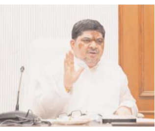
హైదరాబాద్, (త్రైమ్ మిర్రర్): తెలంగాణ ఆర్టీసీ కార్మికులకు ఇచ్చిన ప్రతి హామీని అమలు చేస్తామని మంత్రి పొన్నం ప్రభాకర్ స్పష్టం చేశారు. శనివారం ఉదయం మీడియాతో మాట్లాడుతూ... 32 డిమాండ్లలో 29 - మిగతా 2వ పేజీలో పరిష్కారానికి

వాస్తవాలను వక్రీకరించే ప్రయత్నం తగదు మంత్రి పొన్నం ప్రభాకర్ స్పష్టీకరణ