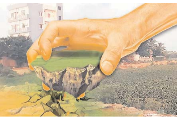
తేలింది. ఇటీవల సదరు స్థలాన్ని శుభ్రం చేసేందుకు వెళ్లిన ప్రస్తుత హక్కుదారుల ద్వారా ఈ విషయం వెలుగులోకి వచ్చింది.