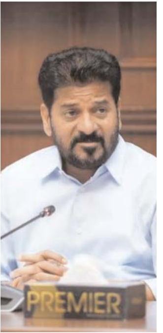
నల్లగొండ, (త్రైమ్ మిర్రర్): తెలంగాణ రాష్ట్రవ్యాప్తంగా రహదారుల రూపురేఖలను మార్చేలా ప్రభుత్వం భారీ ప్రాజెక్టుకు శ్రీకారం చుడుతోంది. హైద్రాద్ యాస్పూటీ - మిగతా 2వ పేజీలో

పశ్చిమ్ రోడ్లకు నేడు సిఎం శంకుస్థాపన నల్లగొండ జిల్లా కనగల్లో నేడు శ్రీకారం