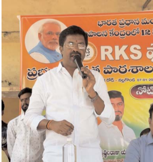
పూర్తిచేయడంపై ప్రశ్నించిన ఆయన, ప్రతి వర్షాకాలంలో ప్రజలు ఎదుర్కొంటున్న ఇబ్బందులకు ప్రభుత్వం పరిష్కారం చూపాలని కోరారు. నగరంలోని క్లాక్ టవర్ నుంచి రామగిరి, రైల్వే ప్లాట్ ఫామ్ వరకు రోడ్ల దుస్థితిని ప్రభుత్వం పట్టించుకోవడం లేదన్నారు. మున్సిపాలిటీలో విలీనమైన గ్రామాల రోడ్ల పరిస్థితి కూడా అధ్వానంగా ఉందని పేర్కొన్నారు. కేంద్ర ప్రభుత్వం నిధులు ఇస్తున్న