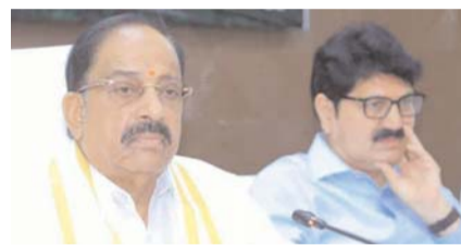
భద్రాద్రి కొత్తగూడెం (త్రైమ్ మిర్రర్): గోదావరి వరదల వల్ల ప్రజానష్టం, పంట నష్టం లేకుండా - మిగతా 3వ పేజీలో

గతానుభవాలతో ముందస్తు నష్టనివారణ చర్యలు పుష్కరాల సందర్భంగా గోదావరి తీరం పరిశుభ్రంగా ఉండాలి అధికారులతో సమాక్షాతం మంత్రి తుమ్మల ఆదేశాలు