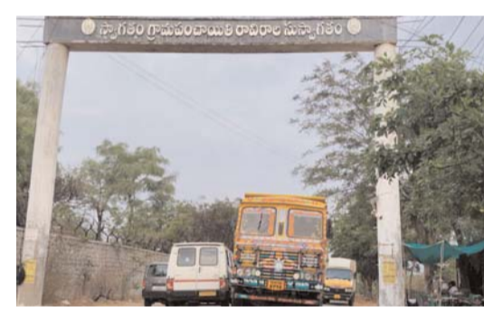
రావిర్యాలకు వెళ్ళే ప్రధాన చౌరస్తాపై తంబాలకు వేలాడుతున్న సి సి కెమెరాలు

ప్రజలకేమో సి సి కెమెరాల పై అవగాహన కల్పిస్తున్నారు...!