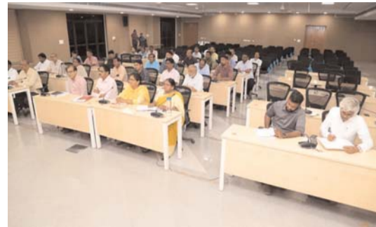
ఇంకా గుంతు, ప్రతి పాలానికి పంట కుంట, ఊరిలో ఊట కుంటల నిర్మాణాన్ని వేగవంతం చేయాలని స్పష్టం చేశారు. మహిళా సంఘాల బలోపేతానికి ప్రభుత్వం పెద్దపీట వేస్తోందని, రాష్ట్రవ్యాప్తంగా 50 లక్షల మంది సంఘం మహిళలకు 30 రకాల ఉచిత వైద్య పరీక్షలు నిర్వహిస్తున్నట్లు తెలిపారు. విద్యార్థుల యూనిఫాంల తయారీ బాధ్యతను మహిళాకే అప్పగించి ఆదాయ వనరులు పెంచామన్నారు. స్వయం సహాయక సంఘాల సభ్యులు సెంట్రాల్, మైయాండ్ ఇటుకల తయారీ పంటి వ్యాపారాల్లో రాణించేలా చేయాలనివ్వాలని ఆధికారులను ఆదేశించారు. త్వరలోనే పింఛన్ విషయంలో ప్రభుత్వం నుంచి ఒక శుభవార్త వస్తుందని, లబ్ధిదారుల జీవన ప్రామాణీకరణను పక్కనపెట్టిగా చేపట్టాలన్నారు. 'ప్రజాపాలన' దరఖాస్తులను క్షేత్రస్థాయిలో పరిశీలించి పారదర్శకంగా, త్వరగా పరిష్కరించి పోర్టల్లో నమోదు చేయాలని నిర్దేశించారు. మంచుర్యాల జిల్లాలో విద్యాసంస్థల పరిసరాలను శుభ్రంగా

ఉంచుతూ.. విద్యా రంగంలో అమలు చేస్తున్న విధానాలు అభినందనీయమని కొనియాడారు.