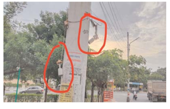
నిఘా వ్యవస్థ నిద్రపై... క్రైమ్ మిర్రర్ కాపు కాస్తుంది.

ఎదైనా సంఘటన జరిగితే గానీ సీసీ కెమెరాల పై దృష్టిపెట్టారా...?