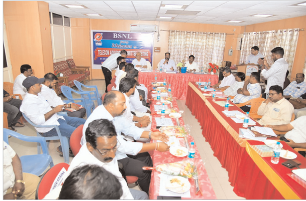
ఎల్లప్పుడూ ఉంటుందని హామీ ఇచ్చారు.

టెలికాం అడ్వైజరీ కమిటీ సభ్యుల నుంచి పలు సూచనలను స్వీకరించాక సిగ్నల్ సమస్యలు ఎక్కువగా ఉన్న ప్రాంతాలను గుర్తించి, యుద్ధప్రాతిపదికన కొత్త టవర్ల ఏర్పాటుకు చర్యలు తీసుకోవాలని అధికారులను ఆదేశించారు. నెట్ వర్క్ విస్తరణలో ఎదురవుతున్న అడ్డంకులను అధిగమించేందుకు తన సహకారం