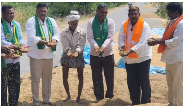
పలు గ్రామాల్లో కళ్యాణ్ ను సందర్శించి రైతులతో మాట్లాడారు. తడిసిన ధాన్యాన్ని చూసి రైతులు వ్యక్త