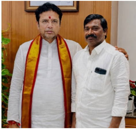
సదుపాయాలు మెరుగుపడనున్నాయి. సూరారం గ్రామానికి రూ. 10 లక్షల

క్రైమ్ మిర్రర్, భూపాలపల్లి ప్రతినిధి మంథని శాసనసభ నియోజకవర్గ అభివృద్ధికి తెలంగాణ ప్రభుత్వం భారీగా నిధులు కేటాయిస్తూ కీలక నిర్ణయం తీసుకుంది. మొత్తం రూ. 15 కోట్ల అంచనా వ్యయంతో సుమారు 300 మౌలిక సదుపాయాల పనులకు పరిపాలనా అనుమతులు మంజూరయ్యాయి. ఈ పనుల ద్వారా గ్రామీణ సదుపాయాలు మెరుగుపడనున్నాయి. ప్రాంతాల్లో రోడ్లు, డ్రెనేజీలు, విద్యుత్, తాగునీటి సూరారం గ్రామానికి రూ. 10 లక్షల