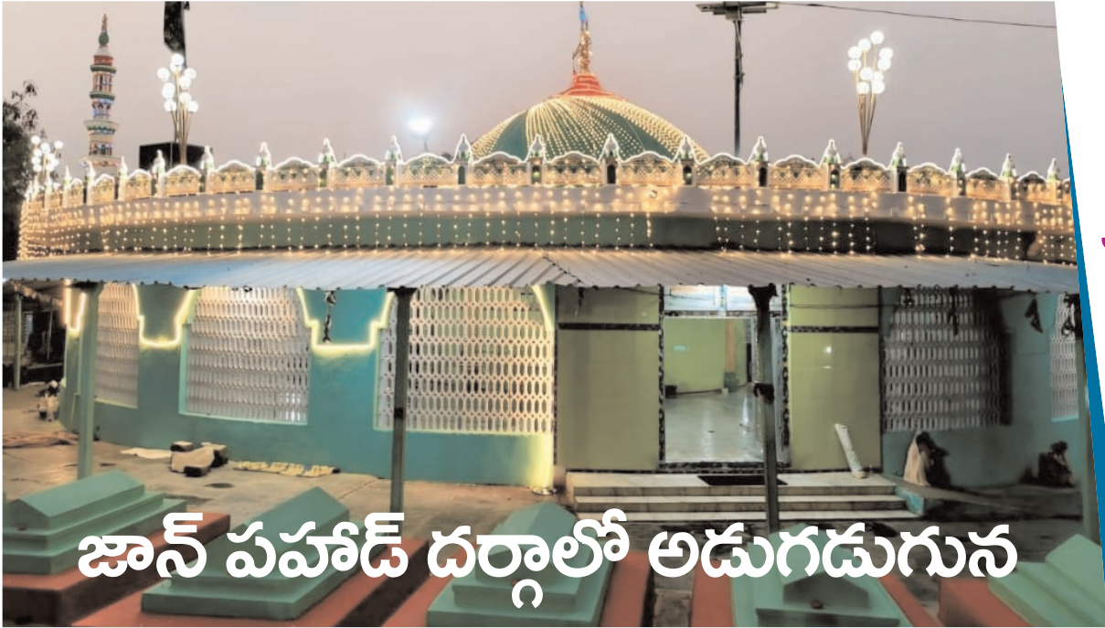
జాన్ పహాడ్ దర్గాలో అడుగడుగున