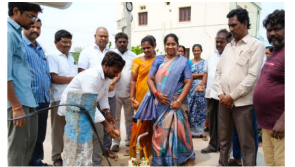
18వ వార్డులో నీటి బోరును ప్రారంభించిన మున్సిపల్ చైర్ పర్సన్