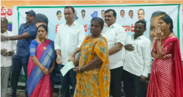
మునుగోడులో 'కళ్యాణ లక్ష్మి' చెక్కుల పంపిణీ