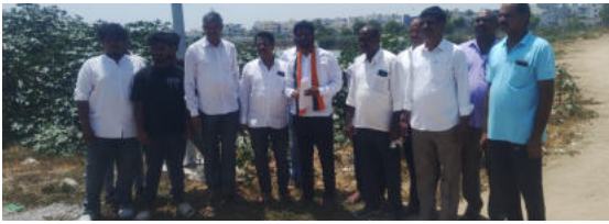
గత ప్రభుత్వంలో చెరువుల అభివృద్ధి పేరుతో దోపిడీ