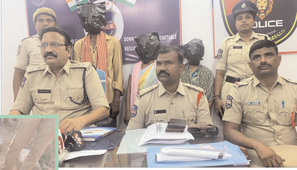
నేనావత్ రాజును అదుపులోకి తీసుకొని విచారించగా హత్య జరిగిన విషయాన్ని అంగీకరించారు.