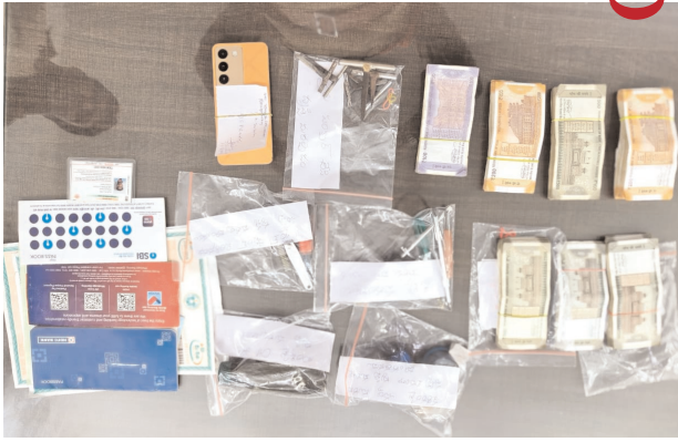
2.20 లక్షల నగదు లకవరీ, ఇద్దరు నిందితుల అరెస్ట్.