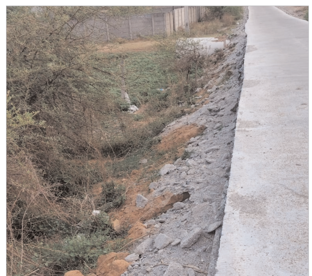
అధికారులు స్పందించి రహదారి ఇరువైపులా మట్టి వేసి చదును చేయాలని, ప్రమాదాలు జరగకుండా చర్యలు తీసుకోవాలని కోరుతున్నారు.

రామకృష్ణపూర్, మే19(క్రైమ్ మిర్రర్) : క్యాతనపల్లి మున్సిపాలిటీ పరిధిలోని అమరవాది 5వ వార్డులో ఇటీవల నిర్మించిన సీసీ రోడ్డు అసంపూర్తి పనులతో ప్రమాదకరంగా మారింది. అమరవాది నుంచి మంచినీటి వైపు వెళ్లే ప్రధాన మార్గంలో నిర్మించిన ఈ రహదారి ప్రారంభమై రెండు నెలలు గడుస్తున్న ఇరువైపులా మట్టి వేయకపోవడంతో వాహనదారులు తీవ్ర ఇబ్బందులు పడుతున్నారు. సీసీ రోడ్డు నిర్మాణం అనంతరం రహదారి పక్కలను మట్టితో చదును చేయాల్సి ఉండగా, ఆ పనులను కాంట్రాక్టర్లు మధ్యలోనే వదిలేశారని స్థానికులు ఆరోపిస్తున్నారు. దీంతో రోడ్డు అంచులు లోతుగా మారి, ఎదురుగా వాహనాలు వచ్చినప్పుడు పక్కకు తప్పుకునే క్రమంలో ద్వీచక్ర వాహనాలు అదుపుతప్పే పరిస్థితి నెలకొంది. ముఖ్యంగా రాత్రి వేళల్లో రహదారి అంచులు స్పష్టంగా కనిపించకపోవడంతో ప్రమాదాల భయం వెంటాడుతోందని వాహనదారులు చెబుతున్నారు. వర్షాకాలంలో పరిస్థితి మరింత ప్రమాదకరంగా మారే అవకాశం ఉందని స్థానికులు ఆందోళన వ్యక్తం చేస్తున్నారు. ఎన్నో ఏళ్ల తర్వాత రహదారి నిర్మాణం జరిగినా, అసంపూర్తి పనులతో ప్రజలకు ఇబ్బందులు తప్పడం లేదని వార్డు ప్రజలు ఆవేదన వ్యక్తం చేస్తున్నారు. ఇప్పటికైనా వార్డు కౌన్సిలర్ తో పాటు సంబంధిత