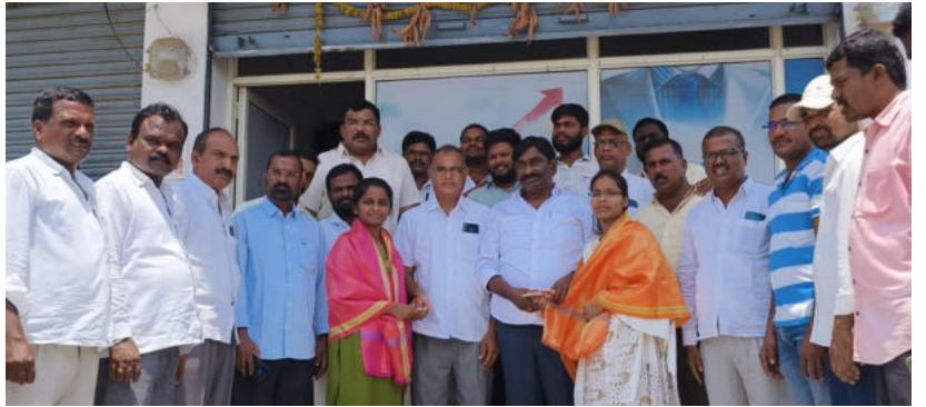
గిఫ్ట్ అందజేశారు. ఈ సందర్భంగా ఆయన మాట్లాడుతూ.. గ్రామీణ ప్రాంతాల్లో సరైన వసతులు లేకున్నా పట్టుదలతో చదివి జాతీయ స్థాయి పోటీ పరీక్షల్లో విజయం సాధించడం ఎంతో గర్వకారణం అన్నారు. కేసీఆర్ ప్రవేశపెట్టిన గురుకులంలో ఈ విద్యార్థులు చదివి విద్యార్థులు తమ నైపుణ్యాన్ని లక్ష్యాన్ని