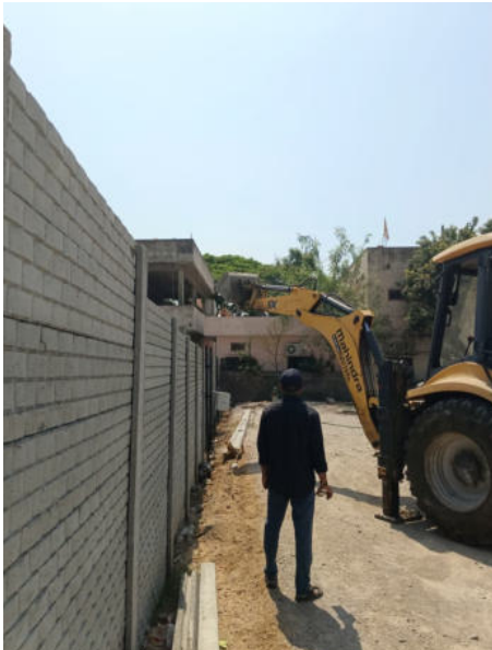
కొనుగోలు చేసే ముందు సంబంధిత అనుమతులు, లేఅవుట్ ఆమోదాలు, రిజిస్ట్రేషన్