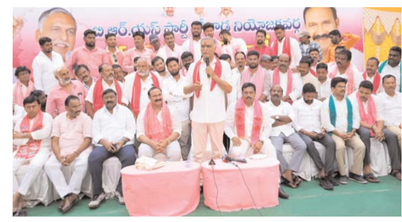
కోదాడ మాజీ శాసనసభ్యులు

“కోదాడలో బీఆర్ఎస్ శక్తి ప్రదర్శన... కార్యకర్తల్లో జోషీ నింపిన హరీష్ రావు”