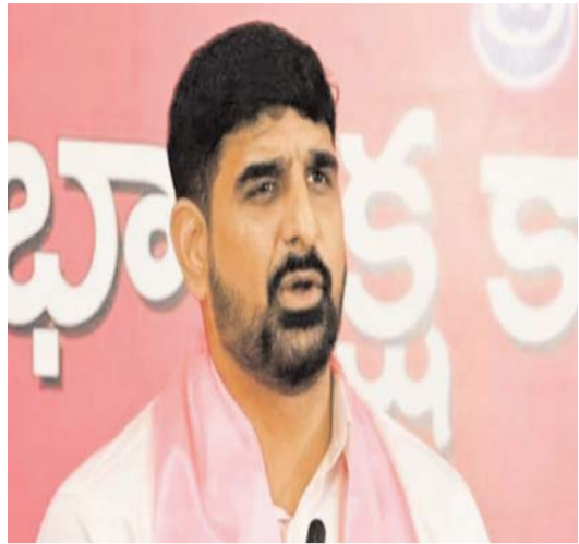
సమృద్ధి సారమ్మ జాతరలో ఒక పోలీస్ అధికారిని మతం పేరుతో దూషించారని ఆరోపణలు కూడా వచ్చాయి. అప్పట్లో ఆయన క్షమాపణలు చెప్పారు కానీ.. గులాబీ

ఇప్పుడు ఈ ఏకంగా బిజెపి కేంద్రమంత్రి పై ఆయన అనుచిత వ్యాఖ్యలు చేశారు. ఒక ఎమ్మెల్యేగా బాధ్యతాయుతమైన పదవిలో ఉండి.. సాటి నాయకులపై ఆయన విరుచుకుపడుతున్న తీరు విమర్శలకు తావిస్తోంది. అప్పట్లో కడియం శ్రీహరి పై చేసిన వ్యాఖ్యల నేపథ్యంలో ఎఫ్డీ కమిటీ రంగంలోకి దిగింది. ఆయనపై వేటు పడుతుందన్న టాక్ అప్పట్లో వినిపించింది. ఇప్పుడు ఏకంగా కేంద్రమంత్రి పై అనుచిత వ్యాఖ్యలు చేయడంపై బీజేపీ శ్రేణులు మండిపడ్డాయి. అయితే పాడి కౌశిక్ రెడ్డి తీరుతో గులాబీ పార్టీకి ఇబ్బందులే అని టాక్ నడుస్తోంది.