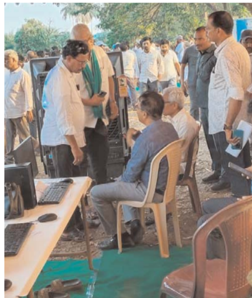
ప్రభుత్వం సంబంధిత అధికారులు రైతులకు అవసరమైన

ఖమ్మం క్రైమ్ మిర్రర్ బ్యూరో: నేలకొండపల్లి మండల వ్యాప్తంగా ప్రభుత్వ ఏర్పాటు చేసిన మొక్కజొన్న ధాన్యం కొనుగోలు కేంద్రాలలో నెలకొన్న సమస్యలపై తెలంగాణ రైతు సంఘం, సిపిఐ(ఎం) ఆధ్వర్యంలో బుధవారం మండలంలోని గువ్వలగూడం గ్రామంలో జరిగిన ప్రజా దర్బార్ కార్యక్రమంలో కలెక్టర్లు విన్నవించారు. ఈ సందర్భంగా తెలంగాణ రైతు సంఘం రాష్ట్ర నాయకులు గొడవర్తి నాగేశ్వరరావు మాట్లాడుతూ మండల వ్యాప్తంగా మొక్కజొన్న ధాన్యం ఎగుమతుల్లో నెలకొన్న సమస్యలపై రైతులు తీవ్ర ఆందోళన వ్యక్తం చేస్తున్నారని అన్నారు. గత కొద్ది రోజుల క్రితం కురిసిన అకాల వర్షానికి కొనుగోలు కేంద్రాలలో కాంటాలు వేసి నిల్వ ఉన్న బస్తాలు సైతం తడిచి పోవడంతో రైతులకు తీరిన నష్టం వాటిలిందన్నారు. వందల సంఖ్యలో ధాన్యం, మొక్కజొన్న రాశులు తడిసి ముద్దోవడంతోపాటు వరద నీటిలో కొట్టుకొని పోయాయన్నారు. కొనుగోలు కేంద్రాలలో