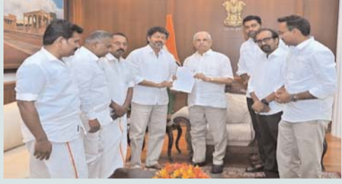
విజయ్ కు తమిళ గవర్నర్

PUBLISHED FROM HYDERABAD CIRCULATED BY RANGAREDDY, NALGONDA, KHAMMAM, KARIMNAGAR, WARANGAL, MAHABOONAGAR, MEDAK, NIZAMABAD, ADILABAD