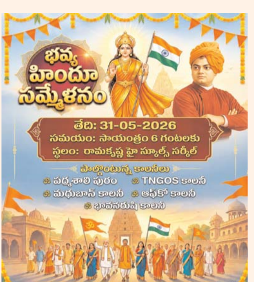
కోరారు. ఒక్కటే సమాజమే శక్తివంతమైన దేశానికి పునాది... సనాతన ధర్మ పరిరక్షణ ప్రతి భారతీయూడి బాధ్యత అని నిర్వాహకులు స్పష్టం చేశారు.

గర్వకారణం... హిందూ సమాజ ఐక్యతే భారతదేశ బలం అని పేర్కొన్నారు. సనాతన ధర్మం ప్రపంచానికి శాంతి, సహనం, మానవతా విలువలను అందించిన మహోన్నత జీవన విధానమని తెలిపారు. ప్రతి కుటుంబం, ప్రతి యువకుడు, ప్రతి మహిళా ధార్మిక చైతన్యంతో సమాజ అభివృద్ధిలో భాగస్వాములు కావాలని పిలుపునిచ్చారు. ఆర్ఎస్ఎస్ శతాబ్ది ఉత్సవాలు కేవలం ఒక సంస్థ వేడుకలు మాత్రమే కాకుండా, భారతీయ సంస్కృతి వైభవాన్ని ప్రపంచానికి చాటి చెప్పే చారిత్రాత్మక ఘట్టమని పేర్కొన్నారు. సమాజంలో సేవా కార్యక్రమాలు, సాంస్కృతిక పరిరక్షణ, జాతీయ చైతన్యం పెంపొందించడంలో ఆర్ఎస్ఎస్ కీలక పాత్ర పోషిస్తోందని కొనియాడారు. ఈ భవ్య హిందూ సమ్మేళనంలో పద్మశాలి పురం, టీఎన్జీజీఎస్ కాలనీ, మధుభన్ కాలనీ, ఆదర్శ కాలనీ, భావన బుషి కాలనీ ప్రాంతాల ప్రజలు, యువత, మహిళలు, పెద్దలు అధిక సంఖ్యలో పాల్గొని కార్యక్రమాన్ని విజయవంతం చేయాలని నిర్వాహకులు