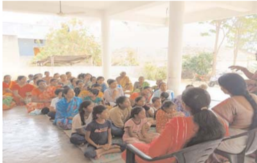
చట్టాన్ని ఉల్లంఘిస్తే కఠిన శిక్షలు:

జగిత్యాల అర్బన్ సికార్-2 లో 'ప్రజా పాలన - ప్రగతి ప్రణాళిక' ఉమెన్స్ వీక్ కార్యక్రమం బాల్య వివాహాలు, పోకోస్ చట్టం, డ్రగ్స్ పై అవగాహన సదస్సు