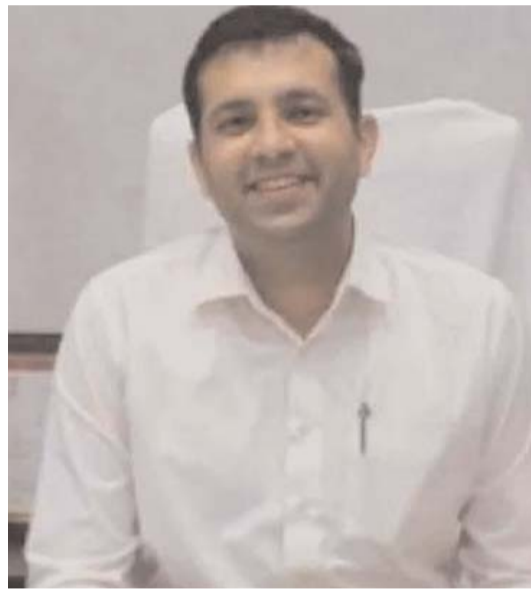
కొనుగోలు విషయంలో రైతులను ఇబ్బంది పెట్టే మధ్యవర్తులు, మిల్లర్లపై కఠిన చర్యలు తీసుకోవాలని హెచ్చరించారు. తాలు, తరుగు పేరుతో రైతులను మోసం చేసే వారిని ఉపేక్షించబోమన్నారు. ప్రజాపాలన