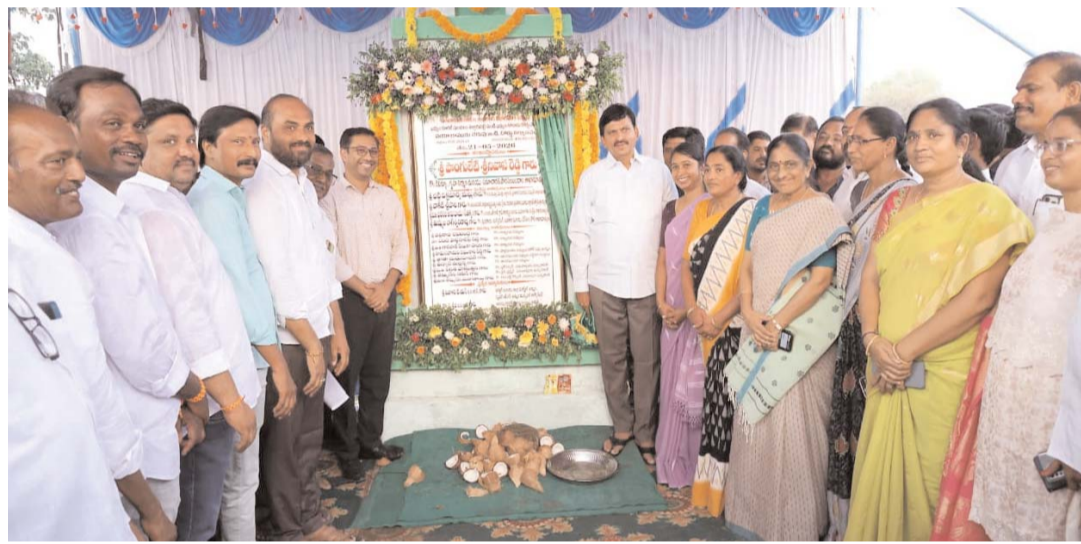
శుభ్రలోనే కొత్త ఆసరా పంపిణీ.