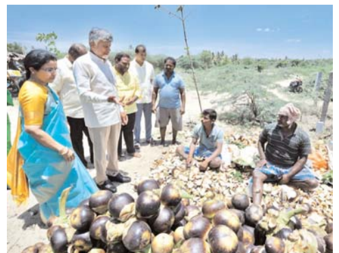
మీడియాలో వైరల్ అవుతున్నాయి.

చిన్నవారి రోజులు జ్ఞాపకానికి వచ్చారున్నారు. తాటి ముంజలు అమ్మే వృత్తి కుటుంబ పరిస్థితులు, వ్యాపారం, దూరకేంద్రమాల గురించి సీఎం అడిగి తెలుసుకున్నారు. ఒక రాష్ట్ర ముఖ్యమంత్రి తన వద్దకు వచ్చి సాదాసీదాగా మాట్లాడటంతో ఆ కార్యకుడు ఆనందంలో మునిగిపోయాడు. ఈ సందర్భంగా గ్రామీణ ప్రజల కష్టం, వారి జీవన విధానం, సహజసిద్ధమైన అహారాల ప్రాధాన్యం గురించి చంద్రబాబు ఆసక్తికర వ్యాఖ్యలు చేశారు. సీఎం దంపతులు చూపిన ఈ నిరాడంబరత, ఆప్యాయతలను అక్కడున్న స్థానికులు ఎంతో ప్రశంసించారు. ఇందుకు సంబంధించిన ఫోటోలు, వీడియోలు ప్రస్తుతం సోషల్ మీడియాలో వైరల్ అవుతున్నాయి.