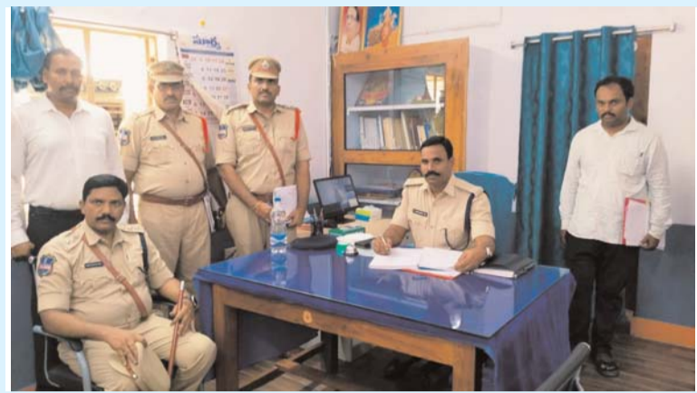
లక్ష్మణ రవాణా పై పట్టి నిఘా. ప్రజల వద్దకే పోలీసులు వెళ్ల సేవలు అందిస్తున్నారు. జిల్లా ఎస్పీ నరసింహ

నూతనకల్ (క్రైమ్ మిర్రర్): పోలీస్ స్టేషన్ల వార్షిక తనిఖీలలో భాగంగా మంగళవారం జిల్లా ఎస్పీ నరసింహ నూతనకల్ పోలీస్ స్టేషన్ తనిఖీ చేశారు. ముందుగా పోలీసు పోలీస్ స్టేషన్ ప్రాంగణం, పరిసరాలు పరిశీలించి, సిబ్బంది యూనిఫామ్, క్రమశిక్షణ, పోలీస్ పరికరాలను పరిశీలించి సమస్యలు అడిగి తెలుసుకున్నారు, ఎలాంటి సమస్య ఉన్న అధికారుల ద్వారా పరిష్కరించుకొనాలని సూచించారు. సిబ్బంది సంక్షేమానికి ఎల్లప్పుడూ కృషి చేస్తామని తెలిపారు. స్టేషన్ అవరణలో సిబ్బందితో కలిసి మొక్కలు నాటారు. పోలీస్ స్టేషన్ రిసెప్షన్ సెంటర్ నందు రికార్డుల నిర్వహణ ఆన్లైన్ ఫిర్యాదుల నిర్వహణను పరిశీలించారు. ఫిర్యాదుదారులతో మర్యాదగా ప్రవర్తిస్తూ వారి సమస్యలు విని వారికి