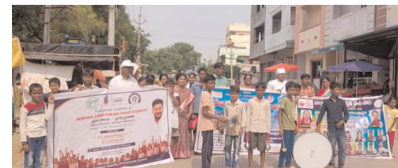
పాఠశాలపై ప్రజల్లో విశ్వాసం మరింత బలపడుతుందని నిర్వాహకులు ఆశాభావం వ్యక్తం చేశారు. ఈ కార్యక్రమంలో పాఠశాల ప్రధానోపాధ్యాయులు, ఉపాధ్యాయులు, జెడ్పీ హెచ్.ఎస్. (బాలర) కాంగర రావిర్యాల విద్యార్థులు పాల్గొన్నారు.

మహేశ్వరం ప్రతినిధి (క్రీమ్ మిర్రర్): మహేశ్వరం నియోజకవర్గం రావిర్యాలలో ప్రజాపాలన ప్రగతి ప్రణాళిక -- విద్యా వారోత్సవాలలో భాగంగా ప్రభుత్వ పాఠశాలలో విద్యార్థుల నమోదు పెంపు, విద్యా ప్రమాణాల అభివృద్ధి మరియు ప్రతి విద్యార్థికి నాణ్యమైన విద్య అందించాలనే లక్ష్యంతో నిర్వహిస్తున్న "బడిబాట" కార్యక్రమం గురువారం ఘనంగా ప్రారంభించారు. ఈ కార్యక్రమంలో ప్రజాప్రతినిధులు, గ్రామ పెద్దలు, తల్లిదండ్రులు, ఉపాధ్యాయులు మరియు విద్యార్థులు పాల్గొన్నారు. గ్రామంలోని ప్రతి ఇంటికి వెళ్లి ప్రభుత్వ పాఠశాలలో అందుబాటులో ఉన్న సౌకర్యాలు, ఉచిత పాఠ్యపుస్తకాలు, యూనిఫాంలు, మధ్యాహ్న భోజన పథకం, డిజిటల్ బోధన, క్రీడలు మరియు నైపుణ్యాభివృద్ధి కార్యక్రమాలపై అవగాహన కల్పించారు. ఈ సందర్భంగా పాఠశాల ప్రధానోపాధ్యాయులు మాట్లాడుతూ... ప్రభుత్వ పాఠశాలలో విద్యార్థుల సమగ్ర అభివృద్ధికి ప్రత్యేక చర్యలు తీసుకుంటున్నామని తెలిపారు. ప్రతి తల్లిదండ్రులు తమ పిల్లలను ప్రభుత్వ పాఠశాలలో చేర్పించి మంచి భవిష్యత్తుకు బాటలు వేయాలని కోరారు. బడిబాట కార్యక్రమం ద్వారా విద్యార్థుల నమోదు మరింత పెరిగి, ప్రభుత్వ