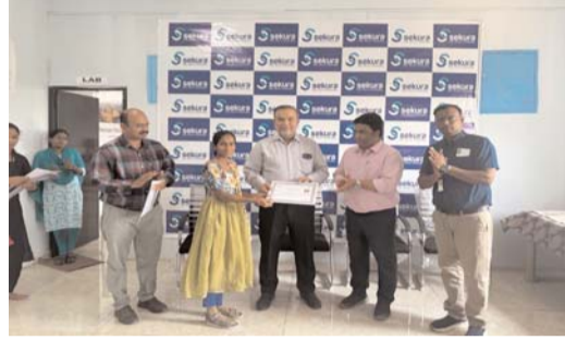
ఫౌండేషన్ కార్యాలయంలో 9701994913/ 6309417288 సంప్రదించవచ్చని తెలిపారు.

తెలిపారు. గ్రామీణ యువతకు ఉపాధి అవకాశాలు కల్పించడమే లక్ష్యంగా మరిన్ని నైపుణ్యాభివృద్ధి కార్యక్రమాలు చేపడతామని పేర్కొన్నారు. త్వరలో కొత్త మల్టీ స్కెల్ టెక్నిషియన్ శిక్షణా బ్యాచ్ ప్రారంభం కానున్నట్లు తెలిపారు. శిక్షణ పొందే అభ్యర్థులకు ఉచిత వసతి, భోజన సదుపాయాలు కల్పించబడతాయని, శిక్షణ అనంతరం ఉద్యోగ నియామకాల కోసం జాబ్ మేళా కూడా నిర్వహించనున్నట్లు వెల్లడించారు. విద్యార్థుల పదవ తరగతి ఉత్తీర్ణత కలిగి ఉండాలని, ఆసక్తి గల అభ్యర్థులు ఆధార్ కార్డు, ఎస్సెస్సీ సర్టిఫికేట్ జిరాక్స్ కాపీలతో బ్రూండావన్ కాలనీ, సంగారెడ్డిలోని పిపల్ ట్రీ