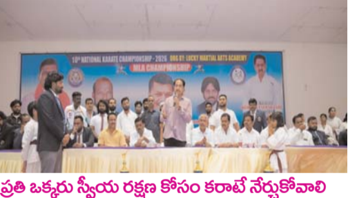
ప్రతి ఒక్కమ స్వీయ రక్షణ కోసం కరాటే నేర్చుకోవాలి

క్రీడల పట్ల ఆసక్తి కలిగిన ఎమ్మెల్యే దొరకడం అధ్యక్షం