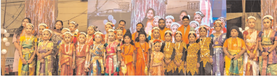
- వేలాదిగా తరలివచ్చిన హిందూ బంధువులు