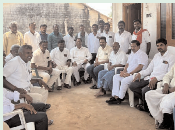
మృతురాలి కుటుంబ సభ్యులను ఏరామర్చించిన మాజీ ఎమ్మెల్యే బూడిద బిక్రమ్ య్యూ గౌడ్

శాతానికి పెరగడం ఉపాధ్యాయుల కృషి ఫలితమని తెలిపారు. మిగిలిన 16 శాతం మంది విద్యార్థులు కూడా పఠన నైపుణ్యాలు సాధించేలా కృషి చేయాలని సూచించారు. ప్రతి రోజూ ఒక గంట సమయం కేటాయిస్తూ పఠన నైపుణ్యాల పెంపుకు ఈ కార్యక్రమం అమలు చేస్తున్నామని అన్నారు. వచ్చే విద్యా సంవత్సరం జూన్ 12 నుంచి మరింత ఉత్సాహంతో కార్యక్రమాన్ని కొనసాగించి, ఇండిపెండెన్స్ డే నాటికి 100 శాతం పఠన నైపుణ్యాలు సాధించాలని లక్ష్యంగా పెట్టుకోవాలని సూచించారు. వాక్యాలు చదవడమే కాకుండా, ప్రవాహంగా చదవడం, అర్థం చేసుకోవడం కూడా సమానంగా ముఖ్యమని అన్నారు. 3వ తరగతికి నిమిషానికి 30 పదాలు, 4వ తరగతికి 40 పదాలు, 5వ తరగతికి 50 పదాలు చదవగలిగే లక్ష్యాలను సాధించాలని సూచించారు. చదివిన విషయాన్ని అర్థం చేసుకునే సామర్థ్యం కూడా పెంపొందించాల్సిన అవసరం ఉందని అన్నారు. ఉపాధ్యాయులు ప్రత్యేకంగా రూపొందించిన టిఎల్ఎం చాలా ఉపయోగకరంగా ఉందని, ముదిగొండలో నిర్వహించిన టిఎల్ఎం మేళా, పోటీలు ప్రశంసనీయమని తెలిపారు. బడి బాట కార్యక్రమంలో “ఎప్రిల్ చైల్డ్ రీడ్స్” వీడియోలను ప్రదర్శించి, ప్రభుత్వ పాఠశాలల్లో నమోదు సంఖ్యను పెంచాలని సూచించారు. ఈ కార్యక్రమం కలెక్టర్ గా తనకు అత్యంత సంతృప్తి ఇచ్చిందని, ఒకసారి పిల్లలు చదవడం ప్రారంభిస్తే వారికి ఇక ఎలాంటి అడ్డంకి ఉండదని తెలిపారు. ఆనతరం ప్రతిభ కనబడిన విద్యార్థులకు బహుమతులు, మెమెంటో, ప్రశంస ప్రతాలను కలెక్టర్ బహుకరించారు. ఈ కార్యక్రమంలో విద్యాశాఖ అధికారులు, ప్రధానోపాధ్యాయులు, ఉపాధ్యాయులు, విద్యార్థులు పాల్గొన్నారు.