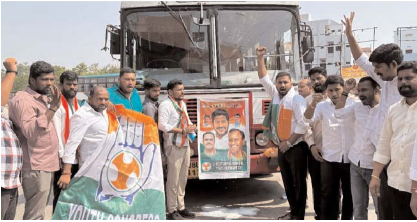
పాల్గొని మాట్లాడుతూ.. ఆర్టీసీ నేతల సమ్మె విరమణకు ముందుకు రావడం