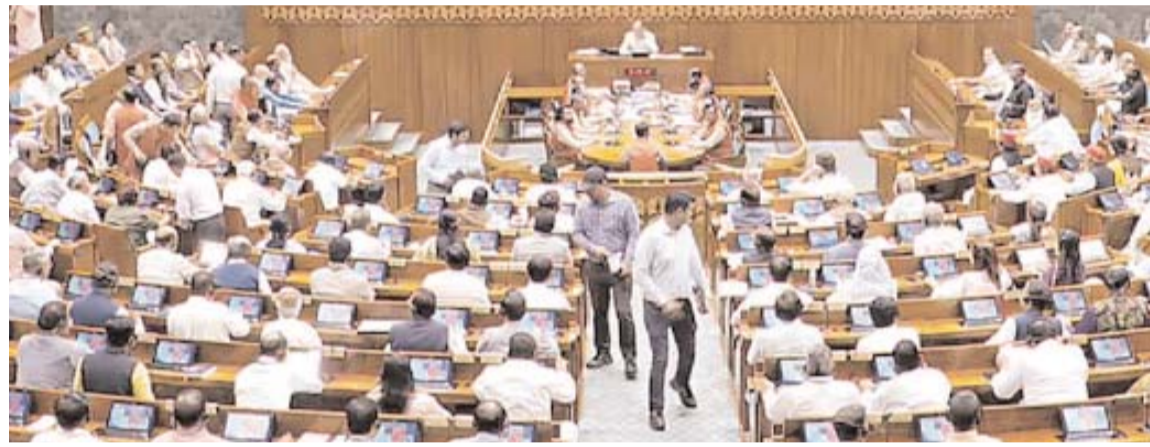
- మిగతా 2వ పేజీలో

న్యూఢిల్లీ, (త్రైమ్ మిర్రర్): మహిళా రిజర్వేషన్ సంబంధించి రాజ్యాంగ సవరణ బిల్లు వీగిపోయింది. కేంద్రం ప్రతిష్టాత్మకంగా తీసుకొచ్చిన 131వ రాజ్యాంగ సవరణ బిల్లు లోక్ సభలో వీగిపోయింది. లోక్ సభలో సుదర్ల చర్చ అనంతరం బిల్లుపై జరిగిన ఓటింగ్ లో మొదలు మొదటిసారి సాధించలేకపోయింది. ఈ బిల్లుతో ముడిపడిన మూడు బిల్లులపై సుదర్ల చర్చ