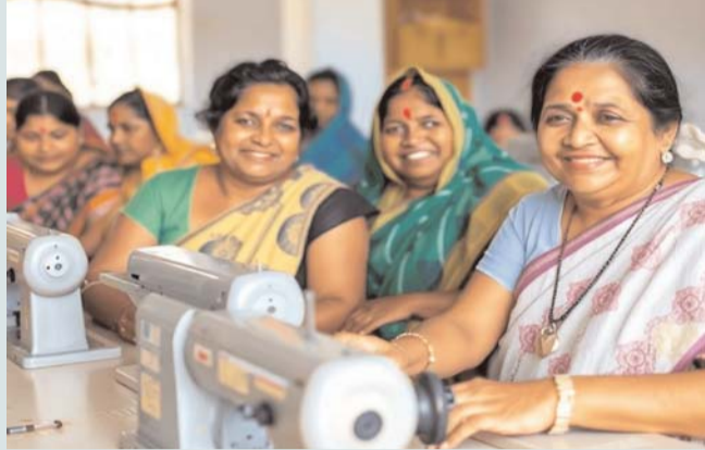
క్రైమ్ మిర్రర్, తెలంగాణ బ్యూరో

తెలంగాణలోని మహిళల కోసం రేవంత్ సర్కారు మరో సరికొత్త పథకాన్ని ప్రవేశపెట్టింది. మహిళలు ఇంటివద్దే స్వయం ఉపాధి పొందేలా.. వారికి ఉచితంగా కుట్టు మిషన్లు పంపిణీ చేయాలని నిర్ణయించింది. ప్రతి నియోజకవర్గంలో 1000 మంది చొప్పున మహిళలకు 100 శాతం సబ్సిడీతో