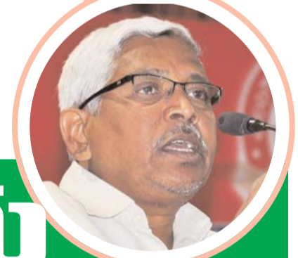
క్రైమ్ మిర్రర్, తెలంగాణ బ్యూరో

కొత్తగా ముగ్గురికి.. ప్రస్తుతం తెలంగాణ క్యాబినెట్లో ఒక మంత్రి పదవి ఖాళీగా ఉంది. కొత్తగా ముగ్గురిని క్యాబినెట్ లోకి తీసుకొని.. ఓ ఇద్దరిని బయటకు పంపారన్న ప్రచారం నడుస్తోంది. తరచు వివాదాస్పద వ్యాఖ్యలతో ప్రభుత్వంతో పాటు పార్టీకి ఇబ్బందులు తెచ్చి పెట్టిన ఓ ఇద్దరు మంత్రులను తొలగించడం ఖాయమని ప్రచారం నడుస్తోంది. అయితే ప్రధానంగా ఓ ముగ్గురు నేతలను క్యాబినెట్ లోకి తీసుకుంటారని టాక్ నడుస్తోంది. ప్రధానంగా ప్రాఫెసర్ కోదండరాం, విజయశాంతి, మహేష్ కుమార్ గౌడ్ పేర్లు వినిపిస్తున్నాయి. ఈ ముగ్గురికి మంత్రి పదవుల విషయంలో పార్టీ హై కమాండ్ తో పాటు సీఎం రేవంత్ రెడ్డి సానుకూలంగా ఉన్నట్లు ప్రచారం నడుస్తోంది. అయితే క్యాబినెట్ నుంచి తొలగించే ఆ ఇద్దరు మంత్రులు ఎవరు అనేది హాట్ టాపిక్ అవుతోంది. అయితే తెలంగాణ