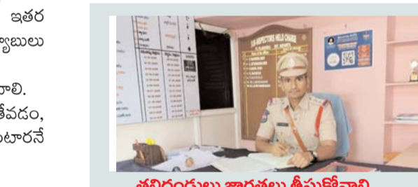
తల్లిదండ్రులు జాగ్రత్తలు తీసుకోవాలి...

ఈత ఆరోగ్యానికి మంచిదే... కానీ..! ఈత పెద్దలు, పిల్లలు అన్న తేడా లేకుండా ఆరోగ్యపరంగా మేలు చేస్తుంది. ఈత కొట్టడం వల్ల వ్యాయామం చేసిన దానికన్నా ఎక్కువ మేలు జరుగుతుందని నిపుణులు చెబుతున్నారు. మధుమేహం, గుండె సంబంధం, తదితర అనేక రకాల వ్యాధులు ఈత వల్ల దూరం కావడంతో పాటు.. మరుగ్గా ఉండడానికి కూడా తోడ్పడుతుందని నిపుణులు పేర్కొంటున్నారు. ఆరోగ్యానికి ఎంతో మేలు చేసే ఈతను నేర్చుకొని.. కొట్టడం చాలా మంచిది.. కానీ జాగ్రత్తలు పాటించకుంటే తగిన మూల్యం చెల్లించుకోవలసి వస్తుందని పలు ప్రదేశాలలో వరుసగా జరుగుతున్న సంఘటనలు నిరూపిస్తున్నాయి.