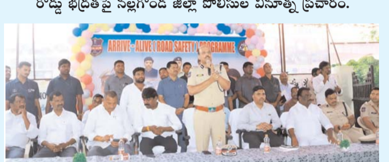
రోడ్డు భద్రతపై సర్కారు జిల్లా పోలీసుల వినూత్న ప్రచారం.

వేగం నీ జీవితాన్ని ఆపేయవచ్చు.. జాగ్రత్త!