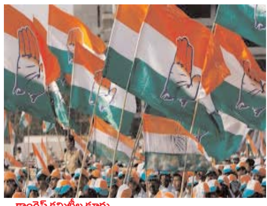
కాంగ్రెస్ కమిటీల కూర్పు.. ఒక్క నామినేటర్ పోస్టుల భర్తీ మాత్రమే కాదు... టిపిసిసి కమిటీ కూర్పు పై కూడా సీఎం రేవంత్ రెడ్డితో కీలక నేతలు చర్చించినట్లు సమాచారం. కాంగ్రెస్ కమిటీలతోపాటు నామినేటర్ పదవుల భర్తీ ఒకేసారి జరగాలని వారు ఒక నిర్ణయం తీసుకున్నట్లు సమాచారం. జిల్లాస్థాయి కమిటీల భర్తీపై కూడా తుది నిర్ణయం తీసుకోనున్నారు. ఇప్పటికే జిల్లా స్థాయి పోస్టుల

(మొదటి పేజీ తరువాయి) సందడి ప్రారంభం అయ్యింది. ఎవరి ప్రయత్నాల్లో వారు ఉన్నట్లు తెలుస్తోంది. జాప్యాన్ని నియంత్రించేందుకు.. తెలంగాణలో కాంగ్రెస్ అధికారంలోకి వచ్చిన తొలిసారిలో నామినేటర్ పోస్టుల భర్తీ చేపట్టారు. తరువాత ఎందుకో ఆ విషయంలో జాప్యాలు జరుగుతూ వస్తోంది. మిగతా పోస్టులపై చాలామంది ఆశాపాలులు ఆశలు పెట్టుకున్నారు. మరోవైపు చూస్తే కాంగ్రెస్ అధికారంలోకి వచ్చి మూడేళ్లు సమీపిస్తుంది. దీంతో మిగతా పోస్టులు భర్తీ చేయాలన్న డిమాండ్ పెరుగుతూ వచ్చింది. అయితే ఎప్పటికప్పుడు జాప్యాలు జరుగుతూ రావడంతో పార్టీలో అసంతృప్తి పెరుగుతోంది. పార్టీ కోసం కష్టపడి పని చేస్తే తమను పట్టించుకునే వారు లేరని చాలామంది భావించగానే వ్యాఖ్యానించిన పరిస్థితి ఉంది. ఈ క్రమంలో హై కమాండ్ కు ఫిర్యాదులు వెళ్లడంతో వీలైనంత త్వరగా పోస్టులు భర్తీ చేయాలని రాష్ట్ర నాయకత్వానికి స్పష్టమైన ఆదేశాలు జారీ చేసినట్లు తెలుస్తోంది.