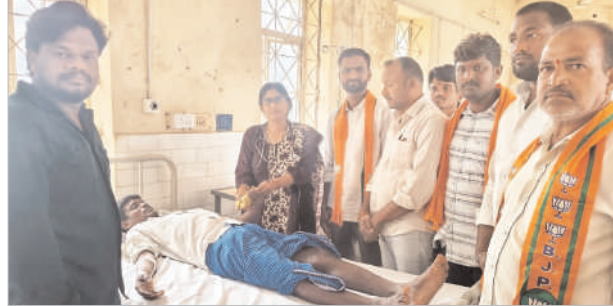
వేడుకలు ఘనంగా నిర్వహించిన కమలనాథులు