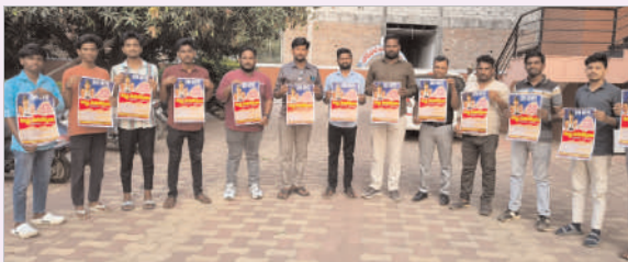
భగత్ సింగ్, రాజ్ గురు సుఖదేవ్ ల స్మారక వారోత్సవాలను జయప్రదం చేయండి..