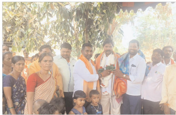
గుంట భూమి విరాళంగా ఇచ్చిన మాజీ సర్పంచ్ ఇరిగి యాదయ్య