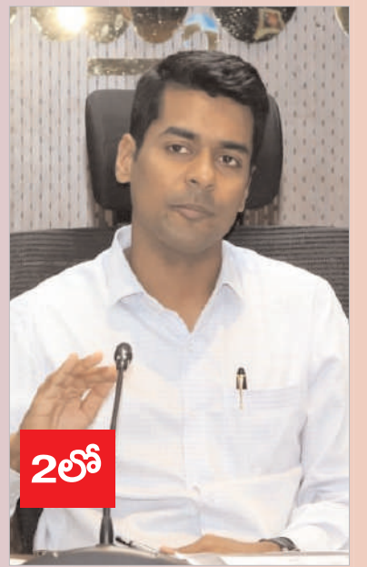
ఖమ్మం (క్రైమ్ మిర్రర్ బ్యూరో)

అంగన్వాడీ కేంద్రాల పనితీరు మెరుగుపడాలని జిల్లా కలెక్టర్ అనుదీప్ దురిశెట్టి అన్నారు. మంగళవారం కలెక్టరేట్ సమావేశ మందిరంలో అంగన్వాడీల పని తీరుపై జిల్లా కలెక్టర్ అనుదీప్ దురిశెట్టి సంబంధిత అధికారులతో సమీక్షించారు. ఈ సందర్భంగా జిల్లా కలెక్టర్ అనుదీప్ దురిశెట్టి మాట్లాడుతూ అంగన్వాడీ కేంద్రానికి కేవలం 36 శాతం మంది పిల్లలు మాత్రమే 21 రోజుల కంటే ఎక్కువగా వస్తున్నారని అంగన్వాడీ కేంద్రాల్లో నాణ్యమైన పాస్టికాహారం మంచి పూర్వ ప్రాథమిక విద్య అందిస్తున్నప్పటికీ పిల్లలు రాకపోవడానికి గల కారణాలను గమనించాలని అన్నారు. అంగన్వాడీ కేంద్రాలలో పిల్లల ఎదుగుదలను ఎప్పటికప్పుడు గమనిస్తూ లోపం ఉంటే వెంటనే అవసరమైన పోషకాలు అందించేందుకు చర్యలు చేపట్టడం జరుగుతుందని ఈ అంశాన్ని తల్లిదండ్రులకు విస్తృతంగా అవగాహన కల్పించాలని కలెక్టర్ అధికారులకు సూచించారు. సిడిపిఓలు క్షేత్రస్థాయి పర్యటనలు చేస్తూ ప్రజలలో విశ్వాసం కల్పించి అంగన్వాడీ కేంద్రాలకు పిల్లలు రెగ్యులర్ గా వచ్చేలా కృషి చేయాలని కలెక్టర్ తెలిపారు.