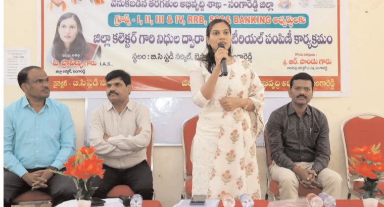
స్టడీ మెటీరియల్ పంపిణీతో విద్యార్థులకు ఉత్సాహం లక్ష్య సాధనకు కృషి తప్పనిసరి పీఎం శ్రీ పాఠశాలల అమలుపై ఉన్నత స్థాయి సమీక్ష నాణ్యమైన విద్య అందించడమే ప్రధాన లక్ష్యం 10వ, 12వ తరగతి ఫలితాల మెరుగుదలపై ఫోకస్ అటల్ బింకరింగ్ ల్యాబ్ తో విద్యార్థుల్లో సృజనాత్మకత విద్యార్థుల మానసిక ఆరోగ్యానికి కౌన్సిలింగ్ సదుపాయం