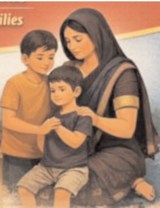
పథకం వివరాలను ప్రజలకు తెలియజేసి అర్హులైన కుటుంబాలు ఈ పథకం ద్వారా అర్హి పొందేలా

కుటుంబ పెద్ద మరణిస్తే రూ.20 వేల సహాయం గ్రామస్థాయిలో అవగాహన కార్యక్రమాలు నిర్వహించాలి బీపీఎల్ కుటుంబాలకు మాత్రమే పథకం వర్తింపు ఎంఆర్ఐవో కార్యాలయం ద్వారా దరఖాస్తుల పరిశీలన జిల్లా కలెక్టర్ పి. ప్రావీణ్య సూచన సంగారెడ్డి, క్రైమ్ మిర్రర్ ప్రతినీతి మార్చి 07: పేద కుటుంబాలకు ఆర్థిక భరోసా కల్పించేందుకు కేంద్ర ప్రభుత్వం అమలు చేస్తున్న నేషనల్ ఫ్యామిలీ బెఫిట్ స్కీమ్ (ఎన్ఎఫ్బీఎస్) ద్వారా అర్హులైన అర్హులకు ప్రయోజనాలు అందేలా చర్యలు తీసుకోవాలని జిల్లా కలెక్టర్ పి. ప్రావీణ్య రెవెన్యూ అధికారులకు సూచించారు. శనివారం విడుదల చేసిన ప్రకటనలో కలెక్టర్ మాట్లాడుతూ... జాతీయ కుటుంబ ప్రయోజన పథకంపై గ్రామ స్థాయిలో విస్తృత ప్రచారం నిర్వహించాలని ఆదేశించారు. గ్రామ సభలు, అవగాహన కార్యక్రమాలు, ప్రచార వాహనాల ద్వారా