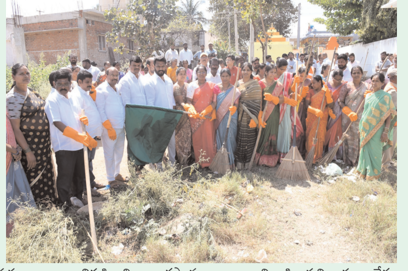
చౌటుప్పల్ పట్టణాభివృద్ధికి శక్తి వంచన లేకుండా కృషి చేస్తా...