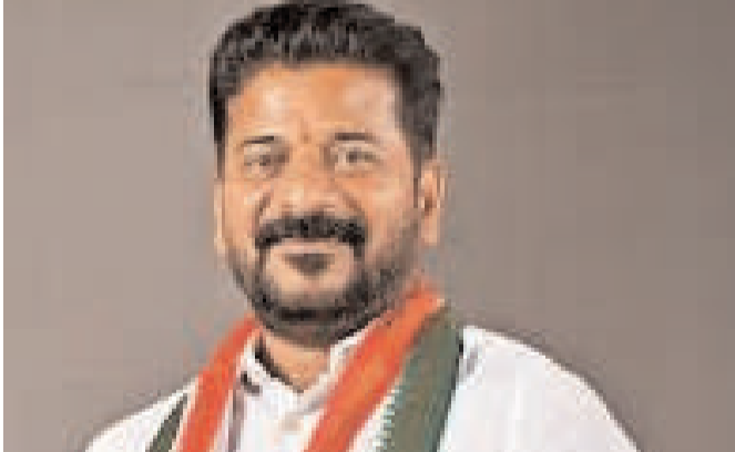
అని ప్రకటించారు. రాజకీయ కార్యక్రమాలకే పరిమితమైన ఎల్పీ స్టేడియాన్ని అంతర్జాతీయ ప్రమాణాలతో అభివృద్ధి చేస్తామని, అద్భుత