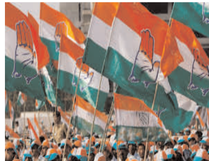
15 మంది సీనియర్లపై గుల్..

ఇటీవల కాంగ్రెస్ పార్టీకి సీనియర్ నేత జీవన్ రెడ్డి గుడ్ బై చెప్పారు. దాదాపు నాలుగు దశాబ్దాల అనుబంధాన్ని విడిచి పెట్టుకున్నారు. కేవలం సీఎం రేవంత్ రెడ్డి తీరుతోనే తాను కాంగ్రెస్ పార్టీకి గుడ్ బై చెప్పినట్లు జీవన్ రెడ్డి ప్రకటించారు. తన నెక్స్ట్ టార్గెట్ రేవంత్ అని తేల్చేశారు. ఆయన మూలంగా తాను ఒక్కడినే కాదని.. సీనియర్లంతా బాధపడుతున్నారంటూ చెప్పుకోవచ్చు. అదే సమయంలో మహబూబ్ నగర్ కు చెందిన