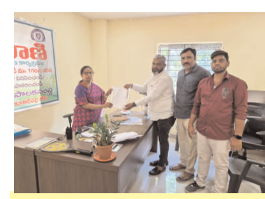
ప్రధాన సమస్యలపై ఫిర్యాదు