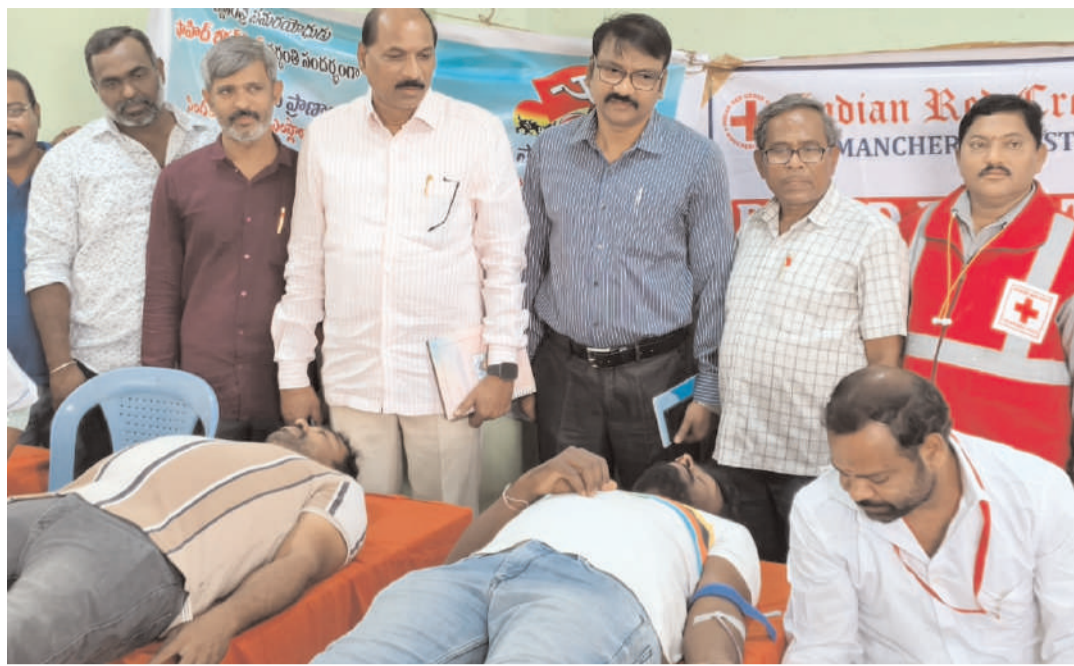
మందమల, మార్చి 23 (క్రైమ్ మిర్రర్): అమరవీరులు భగత్ సింగ్, రాజ్ గురు, సుఖ్ దేవ్ ల 95వ వర్షంతిని పురస్కరించుకుని సింగరేణి కాలరీస్ ఎంప్లాయిస్ యూనియన్ ఎస్సీఈయూ--సీఐటియూ మందమల