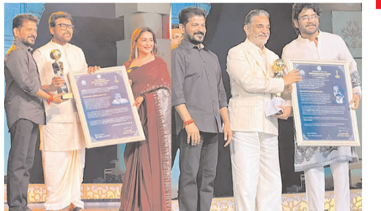
కైమ్ మిస్ట్రర్, తెలంగాణ బ్యూరో

తెలుగు సినిమా కళాకారులకు, సాంకేతిక నిపుణులకు తెలంగాణ ప్రభుత్వం గద్దర్ పేరిట నెలకొల్పిన అవార్డులను ఉగాది పర్వదినాన్ని పురస్కరించుకొని ప్రదానం చేసింది. అయితే సినిమాలకు సంబంధించిన ఈ కార్యక్రమానికి రాష్ట్ర సినిమాటోగ్రఫీ శాఖ మంత్రి కోమటిరెడ్డి వెంకటరెడ్డి మరోసారి గైర్దాజరయ్యారు. అవార్డుల ఎంపిక కమిటీ ఏర్పాటు దగ్గర్నుంచి అందజేత దాకా ఆయన దూరంగానే ఉన్నారు. దీంతో సినిమా పరిశ్రమకు సంబంధించిన విషయాల్లో ప్రభుత్వ పెద్దల మధ్య విభేదాలు వచ్చాయా? అన్న చర్చ జరుగుతోంది.