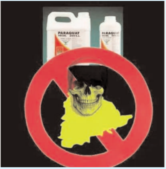
నరకయాతన: ఈ విష ప్రభావం వల్ల మనిషి వెంటనే చనిపోదు; రోజులు లేదా వారాల పాటు నరకాన్ని అనుభవిస్తూ మృత్యువు వైపు సాగుతాడు.

హైదరాబాద్, మార్చి 17 (క్రైమ్ మిర్రర్): రైతుల కష్టంతో పచ్చగా కళకళలాడాల్సిన పొలాలు, నేడు ఒక భయంకరమైన విషపు నీడలో చిక్కుకున్నాయి. కలుపు మొక్కలను చంపడానికి వాడే పారాక్వాట్ అనే రసాయనం, కేవలం గడ్డిని మాత్రమే కాదు.. రైతుల ప్రాణాలను కూడా నిశ్చలంగా బలి తీసుకుంటోంది. పొలాల్లో కొట్టే ఈ మందు, నేడు పల్లెటూరి ప్రాణాలకు ఒక ఉరితాడులా మారుతోంది. ఈ విషానికి విరుగుడు లేకపోవడం వల్ల, క్షణికావేశంలో దీనిని తాగిన వారు ప్రాణాలు కాపాడుకోలేక నరకయాతన అనుభవిస్తున్నారు. 70 దేశాలు ఇప్పటికే దీనిని తరిమికొట్టినా, మన దగ్గర ఇంకా విచ్చలవిడిగా అమ్ముతుంటుంది విచారకరం.