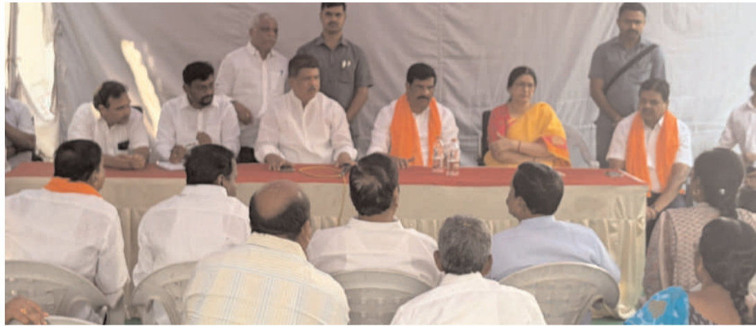
కూకట్ పల్లి రామాలయంలో అన్ని విభాగాల అధికారులతో సమీక్ష సమావేశం