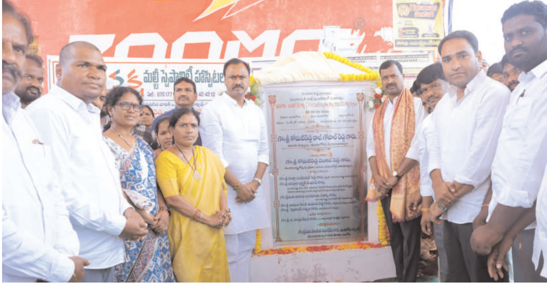
మునుగోడు క్రైమ్ మిర్రర్ ప్రతినిధి: ప్రజా పాలన ప్రగతి ప్రణాళికలో భాగంగా మునుగోడు మండలంలోని పలు గ్రామాల్లో రోడ్డు నిర్మాణ ,అభివృద్ధి పనులకు ఎమ్మెల్సీ నెల్లికంటి సత్యం తో కలిసి ఎమ్మెల్యే కోమటిరెడ్డి రాజగోపాల్ రెడ్డి శంకుస్థాపన చేశారు.. మండలంలోని చల్లెడ నుండి బోత్లగూడెం వరకు కోటి 70 లక్షల రూ

రోడ్డు నిర్మాణ పనులకు ఎమ్మెల్యే, ఎమ్మెల్సీ శంకుస్థాపన ఆనందంలో గ్రామస్థులు