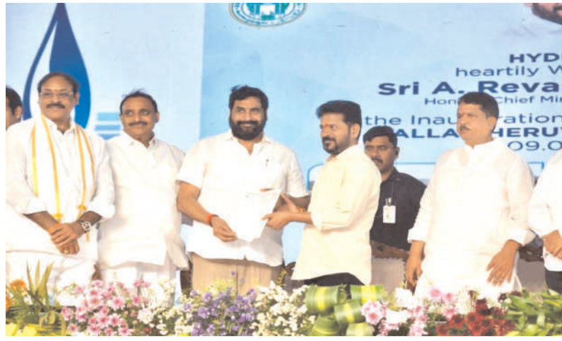
వర్యావరణ పరిరక్షణకు కాంగ్రెస్ ప్రభుత్వం పెద్దపీట

ఆక్రమణలు తొలగించి, కాలుష్యం నివారించి మూసీ నదిని