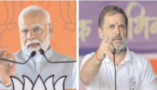
కాదా? ఇంధన ధరలు, ఆర్థిక విద్వంసం మనకు ముఖ్యమైన చర్చనియాంశాలు కావా? అవే మనకు ప్రజా సమస్యలు" అని రాహుల్ గాంధీ అన్నారు. పశ్చిమాసియా సంక్షోభాన్ని తాము ముఖ్యమైనదిగా భావిస్తున్నామని రాహుల్ గాంధీ పేర్కొన్నారు. అందుకే ఆ అంశంపై చర్చను కోరుతున్నామని అన్నారు. "కానీ కేంద్ర సర్కార్ పశ్చిమాసియా సంక్షోభం గురించి చర్చ జరిపేందుకు ఇష్టపడడం లేదు. ఎందుకంటే ఆ అంశంపై చర్చ జరిపితే ఇతర విషయాలు బయటకు వస్తాయి. ప్రధాని మోదీ వైఖరి బయటపడుతుంది. మోదీ

న్యూఢిల్లీ, (త్రైమ్ మిర్రర్): భారత ప్రధాని నరేంద్ర మోదీపై కాంగ్రెస్ అగ్రనేత రాహుల్ గాంధీ మండిపడ్డారు. పశ్చిమాసియా సంక్షోభం గురించి పార్లమెంట్ లో చర్చించడానికి కేంద్ర ప్రభుత్వం ఇష్టపడటం లేదని ఆరోపించారు. పశ్చిమాసియా సంక్షోభం గురించి పార్లమెంట్ లో చర్చ జరిగితే ప్రధాని మోదీ అమెరికా, ఇజ్రాయెల్ కు ఎలా రాజీ పడ్డారో బయటపడుతుందని అన్నారు. పశ్చిమాసియాలో పరిస్థితులు దేశ ప్రజలపై కూడా ప్రతికూల ప్రభావాన్ని చూపుతాయని తెలిపారు. అలాగే అక్కడి సంక్షోభం చమురు ధరల పెరుగుదలకు దారితీయవచ్చని అభిప్రాయపడ్డారు. "పశ్చిమాసియా సంక్షోభం భారత ఆర్థిక వ్యవస్థకు పెద్ద నష్టాన్ని కలిగిస్తుంది. స్టాక్ మార్కెట్ లో ఏం జరుగుతుందో మీరు చూశారు. ప్రధాని మోదీ అమెరికా ట్రేడ్ డీల్ పై సంతకం చేశారు. దీంతో దేశం దెబ్బ తినబోతోంది. అలాగే పశ్చిమాసియా సంక్షోభం గురించి చర్చించడంలో వారికి ఏ సమస్య ఉంది? ఆ తర్వాత మనం ఇతర అంశాలపై చర్చ జరపవచ్చు. పశ్చిమాసియా మన దేశానికి ముఖ్యం