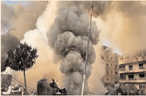
నష్టపరిచేందుకు అమెరికా, ఇజ్రాయెల్ సిద్ధం అయినట్లు కనిపిస్తోంది.

అయితే అమెరికాకు లొంగిపోయే ప్రసక్తి లేదని, ఢిల్లీ పోరాడతామని ఇరాన్ అధ్యక్షుడు షెజ్బెహయాన్ ప్రకటించారు. (ట్రంప్, నెతన్యాయ సమాధుల దాకా తమ పోరాటం కొనసాగుతుందన్నారు. ఆయన ప్రకటన తర్వాత డౌనాల్డ్ ట్రంప్ మాట్లాడుతూ.. ఇరాన్ తో ఒప్పందాలు, చర్చలు ఏమీ లేవని.. ఇరాన్ ను సర్వనాశనం చేస్తామని ప్రకటించారు. దీంతో యుద్ధం మరింత భయంకరంగా మారుతోంది. రెండు రోజులుగా యుద్ధం అత్యంత భయంకరంగా సాగుతోంది. అటు ఇరాన్ కూడా తన చుట్టూ ఉన్న గల్ఫ్ దేశాలపై ఇకపై దాడులు చేయబోమని ప్రకటించింది. కానీ ఆ దేశాల నుంచి అమెరికా ఇరాన్ మీద దాడులు చేస్తే మాత్రం.. ప్రతిదాడులు తప్పవని హెచ్చరించింది. ఇప్పటికే ఈ యుద్ధంలోకి చాలా దేశాల ప్రత్యక్షంగా దిగేందుకు సిద్ధమవుతున్నట్లు తెలుస్తోంది. మరెవైపు ఇరాన్ చమురు ఎగుమతులు పూర్తిగా ఆగిపోయాయి. గల్ఫ్ దేశాల నుంచి ఎలాంటి చమురు ఎగుమతులు ఉండట్లేదు. ఇదే అదనుగా అమెరికా, ఇజ్రాయెల్ తీవ్రంగా దాడులు చేస్తున్నాయి. ఇజ్రాయెల్ మీద ఇరాన్ దాడులు కూడా భీకరంగా సాగుతున్నాయి. ఇలా ఇరు దేశాలు ఒకరిపై ఒకరు అత్యంత భయంకరంగా దాడులు చేసుకుంటున్నాయి. ఇరాన్ తగ్గకపోవడంతో యుద్ధం తీవ్రత మరింత పెరుగుతోంది. అమెరికా, ఇజ్రాయెల్ సైనిక శక్తిని మూకుమ్మడిగా ఎదుర్కునే సామర్థ్యం ఇరాన్ కు లేకపోయినా.. వెనక్కు తగ్గట్లేదు. భీకరంగా ప్రతి దాడులు చేస్తూనే ఉంది. ఈ యుద్ధంలోకి రష్యా, చైనాలను లాగాలని అగ్రరాజ్యం చూస్తోంది. ఆ దేశాలు వచ్చినా రాకపోయినా.. ఇరాన్ ను మరింతగా