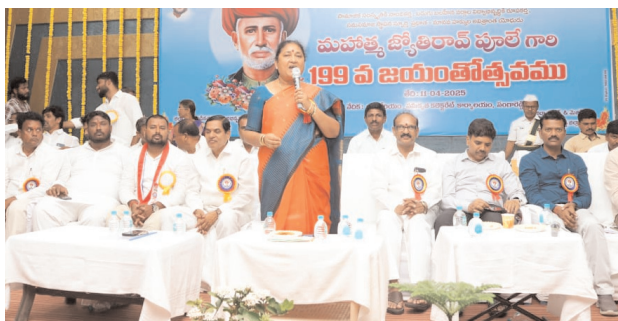
మహాత్మా జ్యోతిరావు పూలే ఆదర్శప్రాయుడు