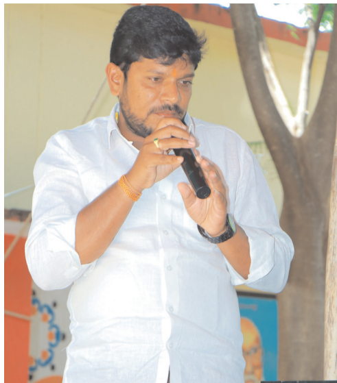
ఓట్లు వేయాలా? అని ప్రశ్నించారు. సిఎం రేవంత్ రెడ్డి ప్రాతినిధ్యం వహిస్తున్న కాంగ్రెస్ నియోజకవర్గంలోని లగచ్చర్ మరియు చుట్టూ పక్కన తండల్లో ఈ నెల 11న అధ్యక్షులు